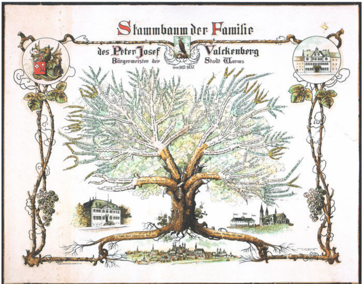
Stammbaum des Peter Joseph Valckenberg