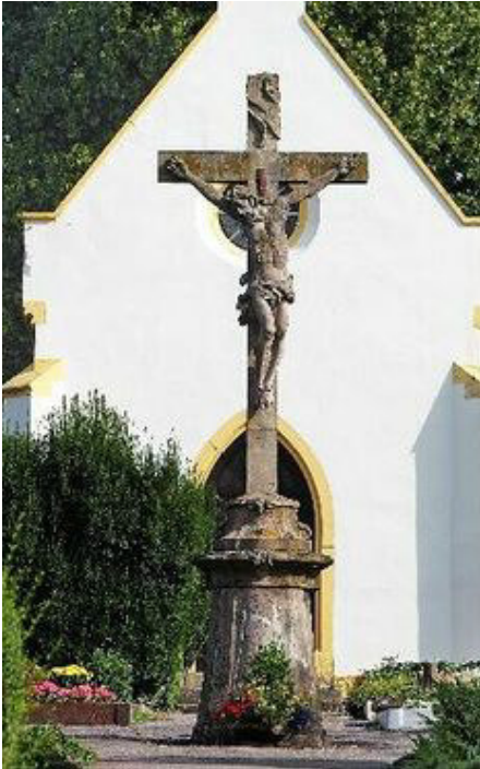
Das barocke Hochkreuz auf dem Hauptweg des Herrnsheimer Friedhofes